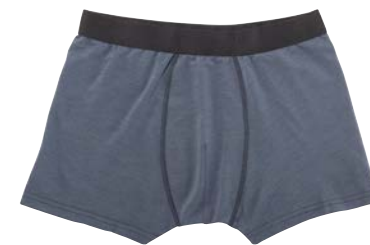
COL.778 50% gekämmte Pima Baumwolle 45% Polyester 5% Elastshan

ART. UW2040 SOFT KNIT JERSEY PANTY S-3XL