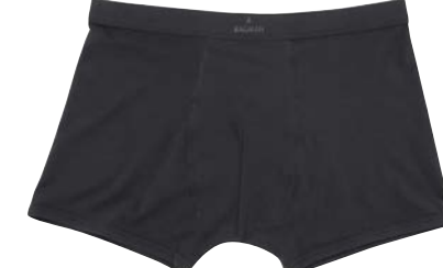
COL.09 95% Pima Baumwolle 5% Elastshan