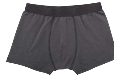
COL.19 50% gekämmte Pima Baumwolle 45% Polyester 5% Elastshan