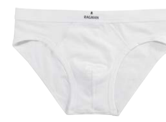
COL.06 95% Pima Baumwolle 5% Elastshan