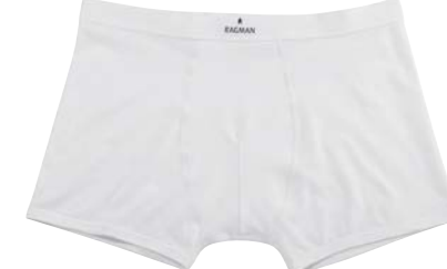
COL.06 95% Pima Baumwolle 5% Elastshan