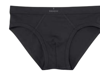
COL.09 95% Pima Baumwolle 5% Elastshan