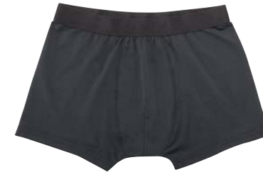
COL.09 50% gekämmte Pima Baumwolle 45% Polyester 5% Elastshan