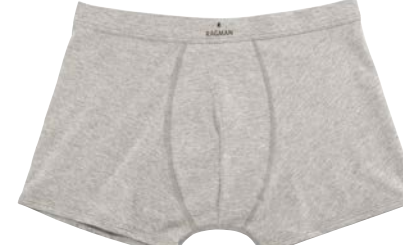
COL.12 85% Pima Baumwolle 10% Polyester 5% Elastshan