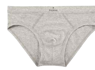
COL.12 85% Pima Baumwolle 10% Polyester 5% Elastshan